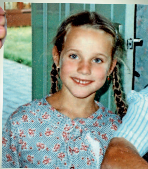
An als kind. Toen al worstelde ze met zichzelf, zonder te weten waarom precies.

➤ ‘Er wordt thuis niet veel over dat donor-verhaal gesproken. Mijn vader weet pas sinds vorig jaar dat ik zijn ‘geheim’ ken’